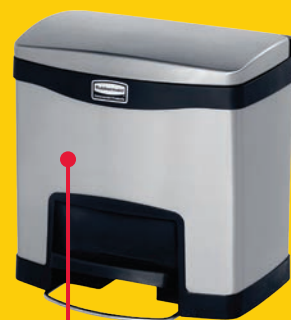
SLIM JIM STEP ON CONTAINERS