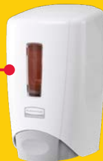
FLEX CLEAN SEAT FOAM 500ML DISPENSER

Soluzioni per migliorare gli standard di igiene pulendo le tavolette dei WC in pochi secondi.