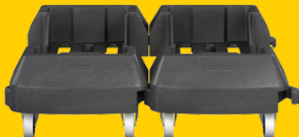
Carrello trainabile in resina